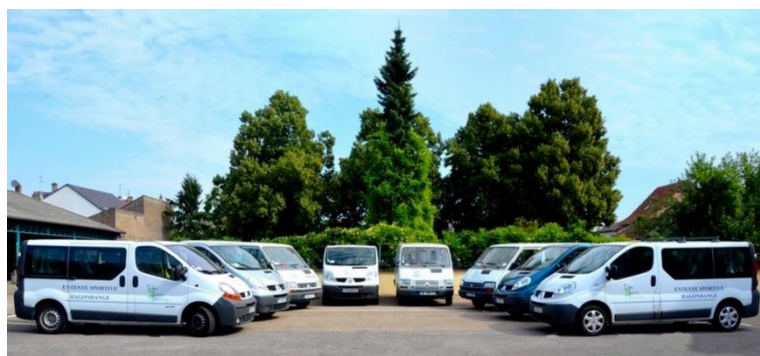
Les véhicules de transports en compétitions (utilisables après réservation)