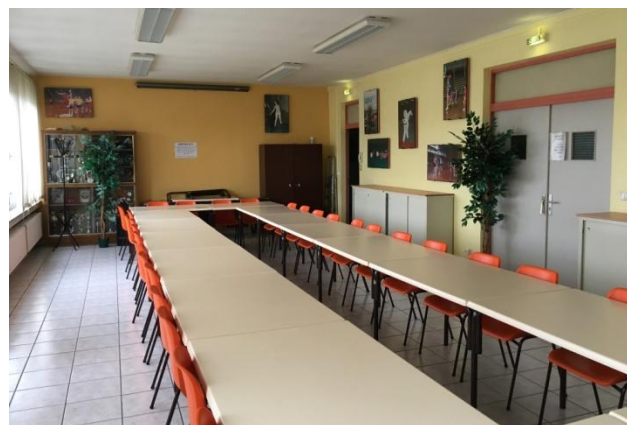
Les Salles de réunions et de convivialité (utilisables après réservation)